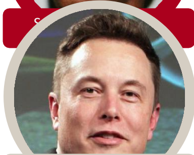
Elon Musk Tesla-âlgadiddje

Moadda dâbdos ulmutja mahkkuli jali li mahkkulam.