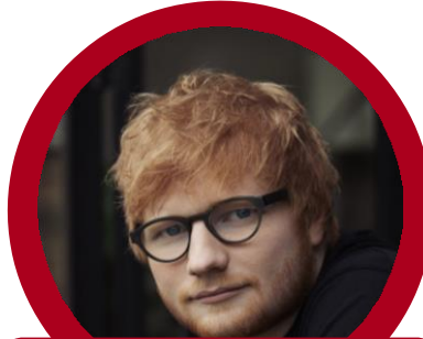
Ed Sheeran artista