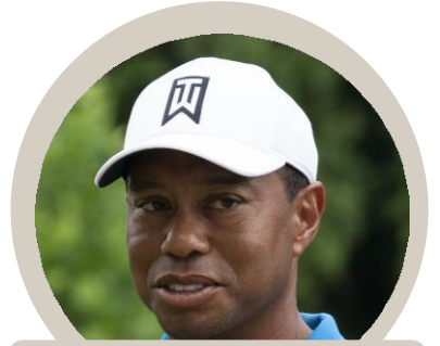
Tiger Woods golfvalástalle