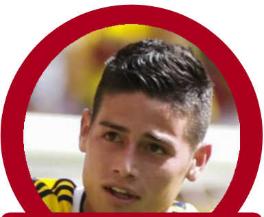
James Rodriguez bálotjiekte