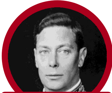
Gonagas Georg VI ávdep Stuurrabritannia gånâgis