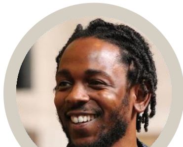
Kendrick Lamar ræppár