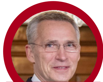
Jens Stoltenberg NATO-oajvve ja âvdep stâhtaministar